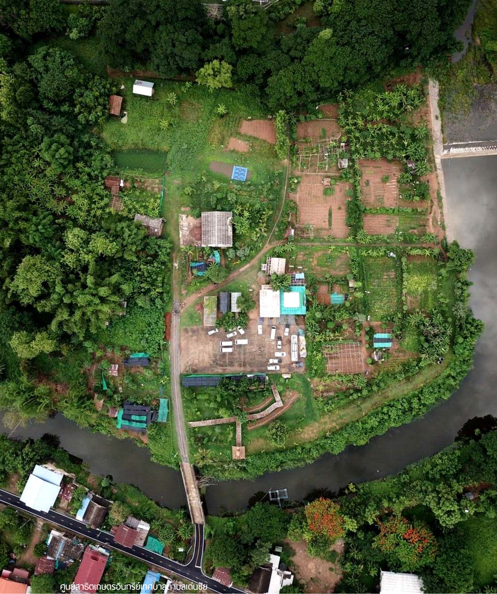
ศูนย์สาริตถเกษตรอินทรีย์เทศบาลตำบลเด่นชัย